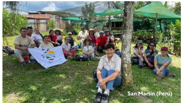
San Martín (Perú)