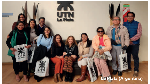
La Plata (Argentina)