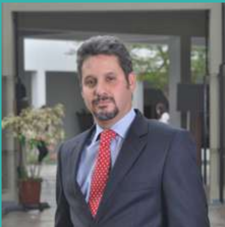
Director de la Maestría

Instituto Internacional para el Aseguramiento de la Calidad